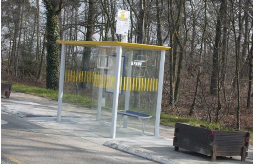
Afbeelding 1: Abri De Lijn-I, generatie 2001