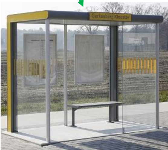
Afbeelding : Abri De Lijn-III generatie 2013