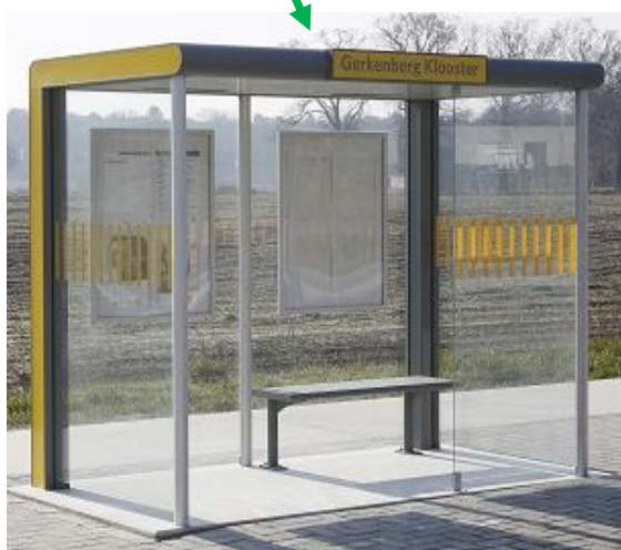
Afbeelding : Abri De Lijn-III generatie 2013