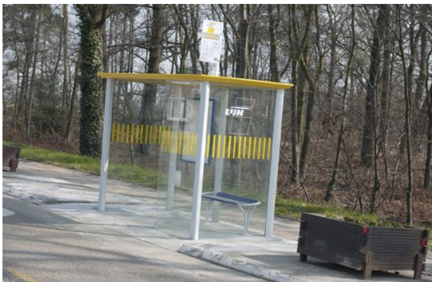
Afbeelding 1: Abri De Lijn-I, generatie 2001